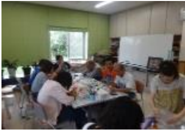
これまでの活動の様子

10月24日(水) 13:30から坂之上病院 デイケアで、デイケア、コパン、かけはし合同 行事として、帖佐人形の絵付け体験があります。 参加費が500円です。