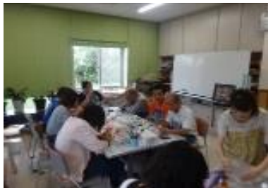
これまでの活動の様子

10月24日(水) 13:30から坂之上病院 デイケアで、デイケア、コパン、かけはし合同 行事として、帖佐人形の絵付け体験があります。 参加費が500円です。